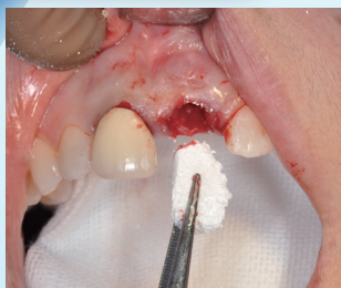
ソケットブリザベーション

インプラント併発症 医学情報社 2011年 一般臨床医のための歯科小手術の スキルアップ ヒョーロン 2014年 補綴臨床連載「インプラントの併発症を考える」 医歯薬出版 2014 他