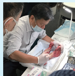
豚骨を使用した実習