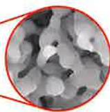
ミクロポア (2 \mu m以下)