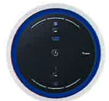
視認性と使いやすさを 備えた操作部